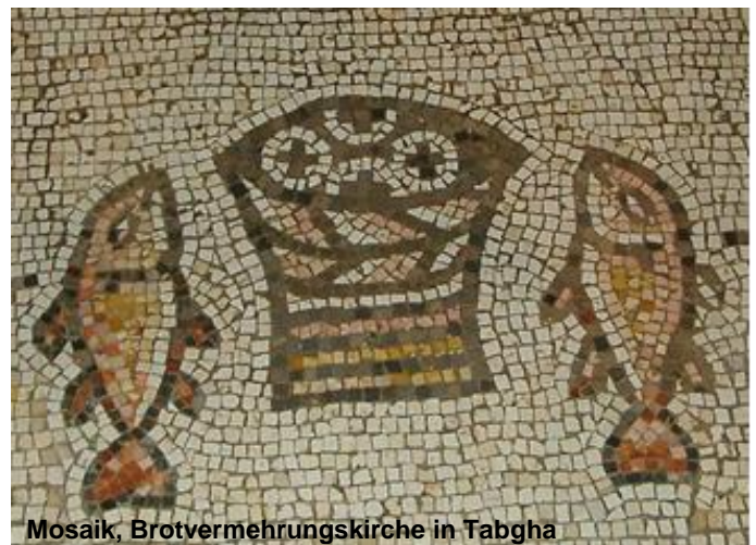
Mosaik, Brotvermehrungskirche in Tabgha