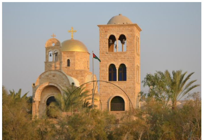
Qasr el Yahud