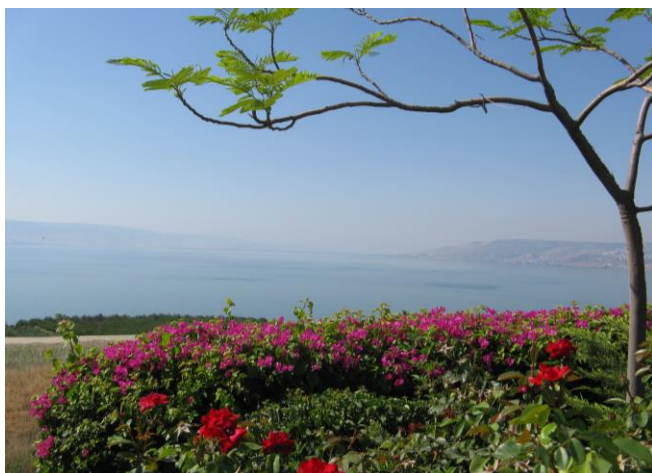
See Genezareth, Blick vom Berg der Seligpreisungen