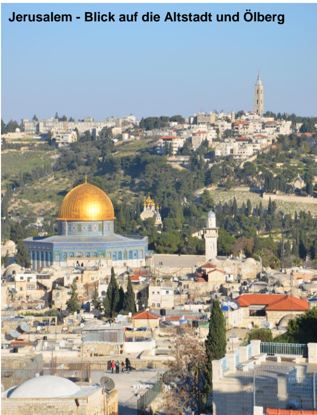
Jerusalem - Blick auf die Altstadt und Ölberg