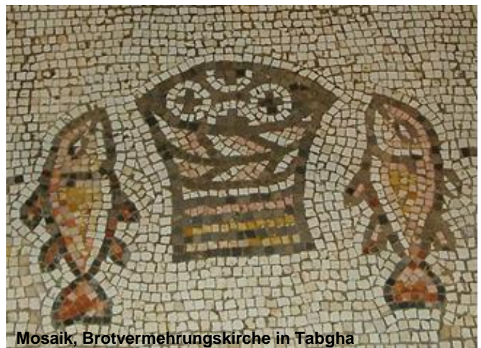
Mosaik, Brotvermehrungskirche in Tabgha