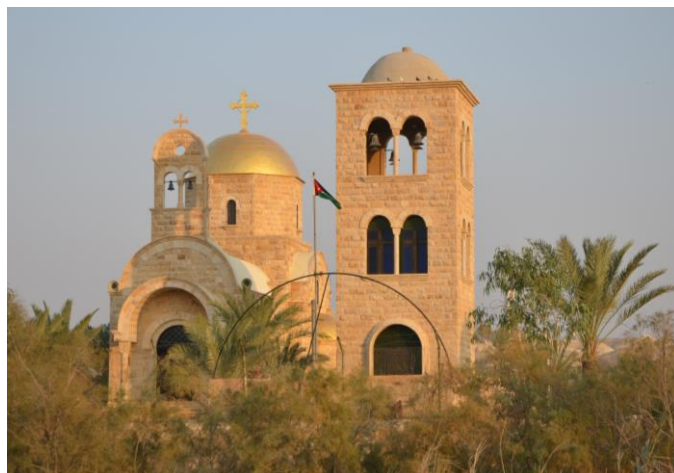
Qasr el Yahud